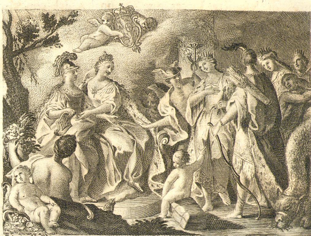
Valencia Año 1754.