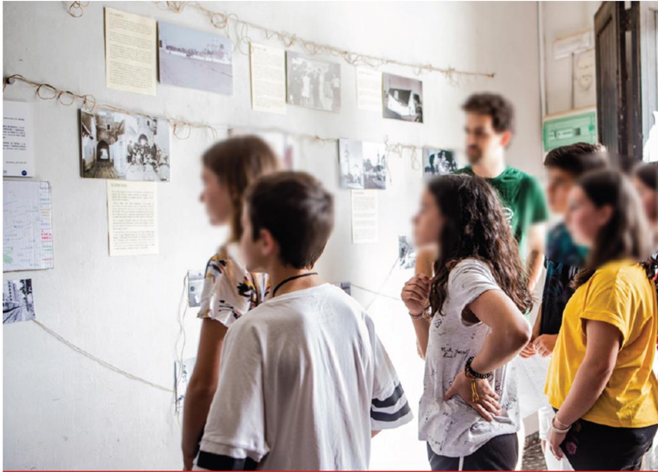
Cuadernos Docentes en Procesos de Desarrollo N°3 "Construyendo relatos alternativos de Benicalap. Una contribución del Aprendizaje en Acción" (2018). Fotografía realizada por María Bruna Malcangi. Con licencia by-nc-nd .