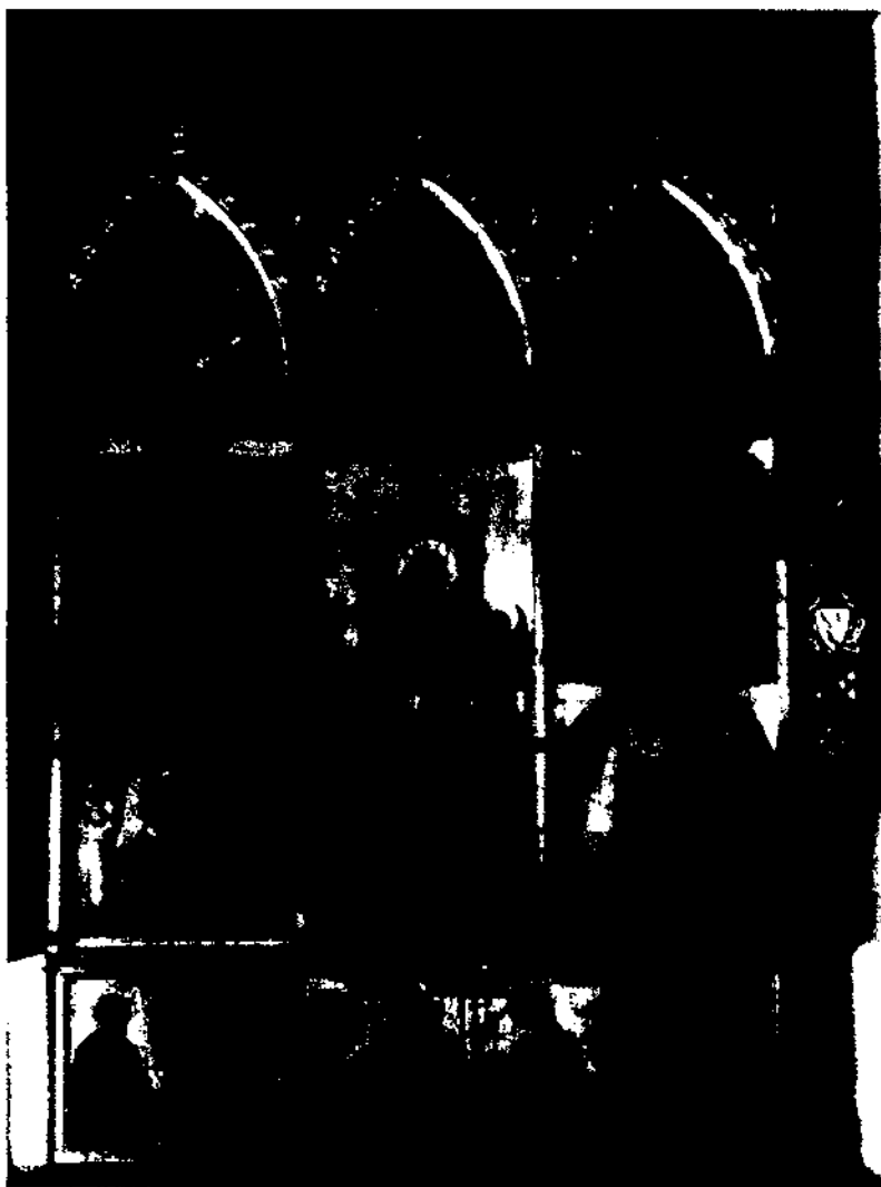
Pere Serra (Barcelona, ca. 1357-1409). Retaule de la Verge (o d'Abella de la Conca), ca. 1375. Museu Diocesà de la Seu d'Urgell. Programa Iconogràfic: Goigs Marianes . Anunciació. Calvari. Resurrecció. Nativitat. Verge i Nen amb dos àngels músics tocant una arpa i una viola d'arc. Epifania. Coronació.