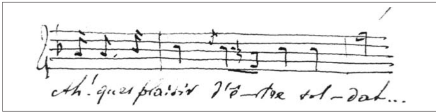
Fig. 3. BC M 964. CUI, César. 17 19-05-1894. Ah! Quel plaisir d'être soldat

En mayo de 1894, César Cui le comenta que está preparando un arreglo a dos voces de Ah! Quel plaisir d'être soldat , de François-Adrien Boïeldieu 38 , y le envía un fragmento copiado de su puño y letra: 39