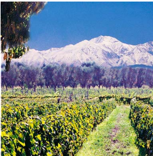
Figura 2. Viñedo en el oasis agrícola