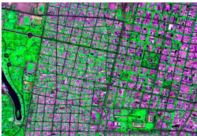
Figura 5. Imagen satelital del área central del AMM

regionales. Porque, como se explicará más abajo, acequias, árboles y viñedos constituyen símbolos de una identidad hegemónica que exalta la gesta de una sociedad exitosa sobre una naturaleza hostil y, particularmente, su capacidad para dominar el agua. Como ejemplo, vale mencionar las apreciaciones de una habitante de un conjunto de vivienda social de la zona pedemontana del AMM respecto del arbolado urbano de su barrio, principalmente compuesto por Aguaribay/Pimientos ( Schinus molle ): “¡A nosotros nos ponen árboles de pobres!” 8 , reclamaba por comparación a las frondosas arboledas de plátanos y tipas del centro de la ciudad. Estos “árboles de pobres” son una especie originaria de América del Sur, de hojas pequeñas y gran rusticidad, que reconocen una tradición de usos rituales por parte de comunidades andinas. Pero en el AMM algunas partes de la ciudad – particularmente la “nueva ciudad” fundada en la segunda mitad del s. XIX- pueden asumir los costos hídricos del paisaje al estilo europeo, mientras que otros sectores se ven obligados a eufemizar 9 la pobreza y la marginación, debiendo conformarse con “ser ecológicos” (Montaña 2006b: 77).