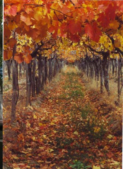
Figura 14. Viñedo en el oasis rural del río Mendoza