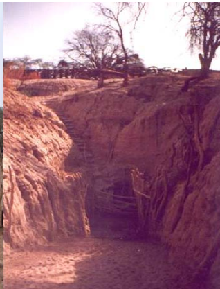
Figura 20. Jagüel