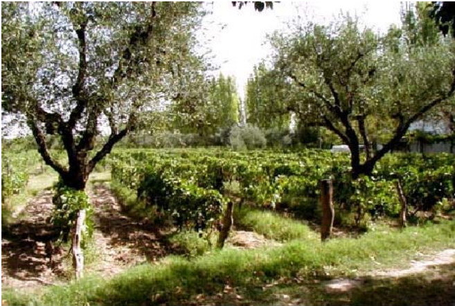
Figura 10. Viñedo tradicional en el corazón del oasis Norte de Mendoza