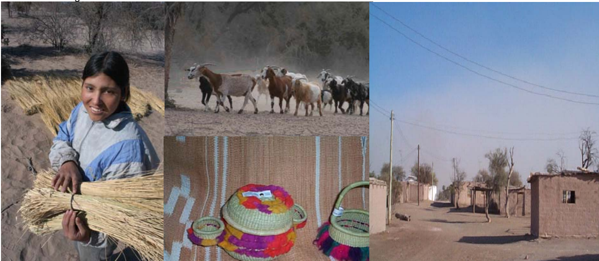
Figura 18. Caserío en zonas no irrigadas del NE de Mendoza