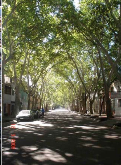
Figura 13. Túnel de árboles en el centro de la ciudad de Mendoza