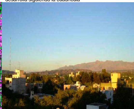
Figura 6. Vista aérea de la misma zona. Los edificios “emergen” dentro de un bosque urbano que se desarrolla siguiendo la cuadrícula

especies menos frondosas y la flora nativa son despreciadas, como es minusvalorado lo indígena y lo andino en las identidades