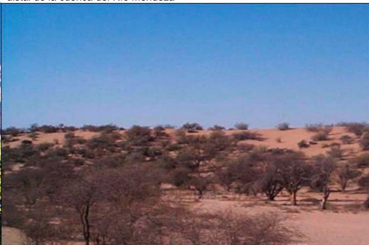
Figura 3. "Desierto" de las planicies no irrigadas del NE de Mendoza, zona distal de la cuenca del Río Mendoza