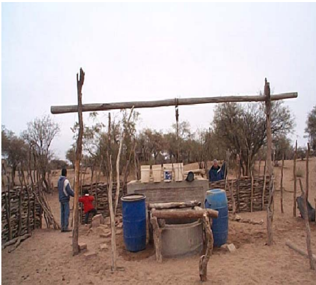
Figura 19. Pozo balde