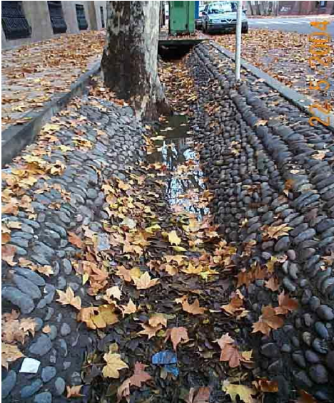
Figura 12. Acequias del centro de la ciudad de Mendoza

Es así como, de modo similar a lo que ocurre en la vitivinicultura, el marketing turístico hace de esa identidad (oficial) construida en torno al agua su sello de originalidad y autenticidad.