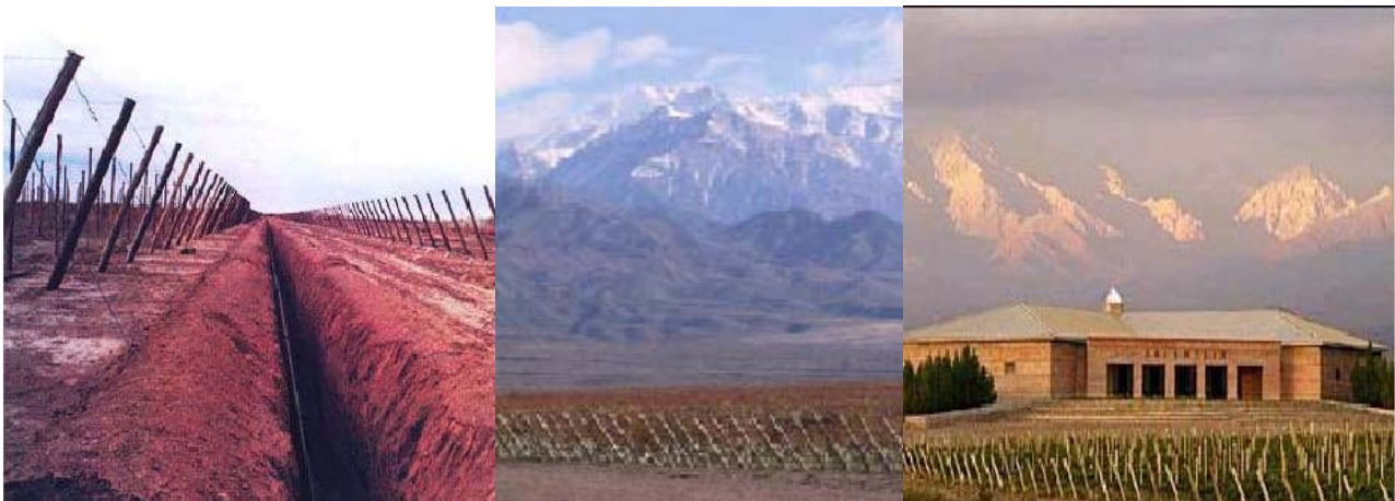
Figuras 7, 8 y 9. Viñedos y bodega de la “nueva vitivinicultura” en el piedemonte del Valle de Uco

Fuente: Elaboración propia. Fuente: Bodega Salentein. Disponible en: http://www.killkasalentein.com/bodega/bodega/espanol/index.html