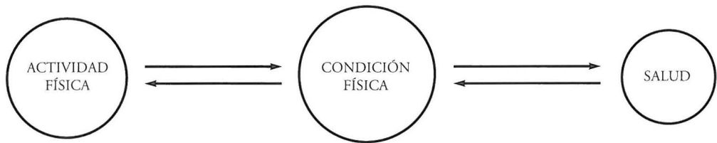
Figura 1. Paradigma centrado en la condición física

relaciones directas con la salud y hacia el que se dirigen las investigaciones y las estrategias de promoción.