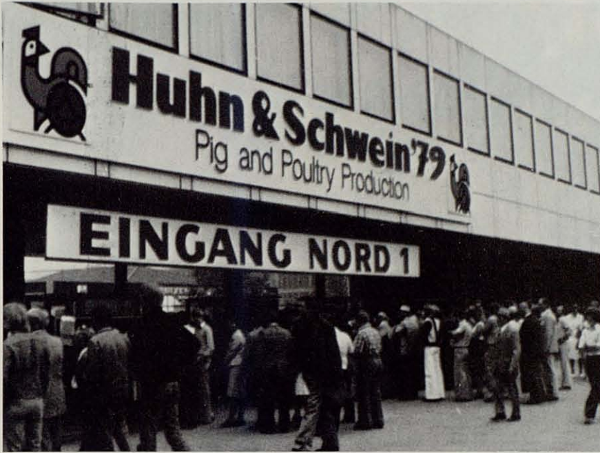
Entrada de la última Exposición de Hannover. Dentro de ella: 508 expositores de 15 países.