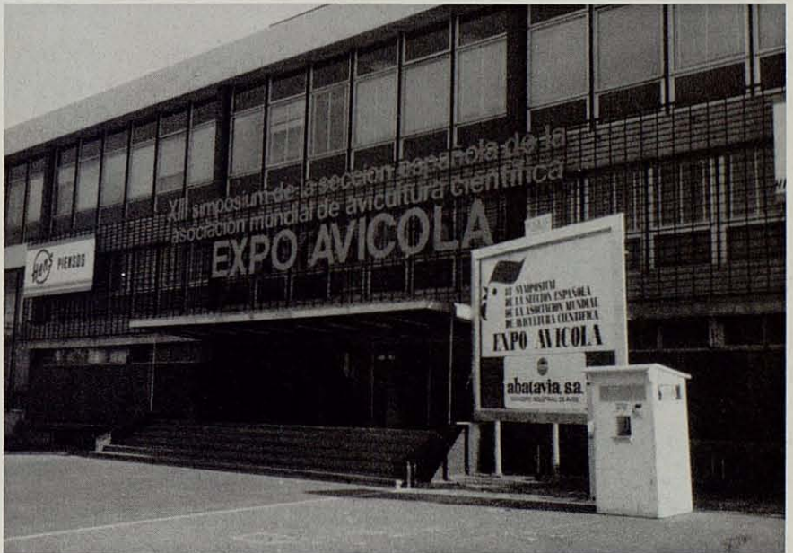
Entrada de la EXPO-AVICOLA 1975, emblema del actual Salón Internacional de Barcelona.

De otra Feria, la de Atlanta, podríamos decir, en fin, que es la que, pese a su modesto título que parece sugerir sólo algo de naturaleza regional, tiene un mayor poder de convocatoria para la potente industria avícola norteamericana, hoy desplazada cada vez más hacia las zonas del Sur y del Oeste de ese país.