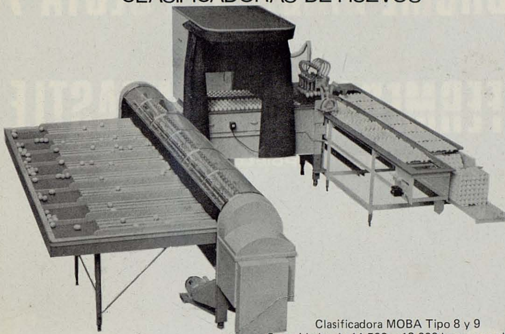
Clasificadora MOBA Tipo 8 y 9 Capacidades de 11.500 y 13.600 huevos por hora. Equipada con suministrador de bandejas de 30 huevos