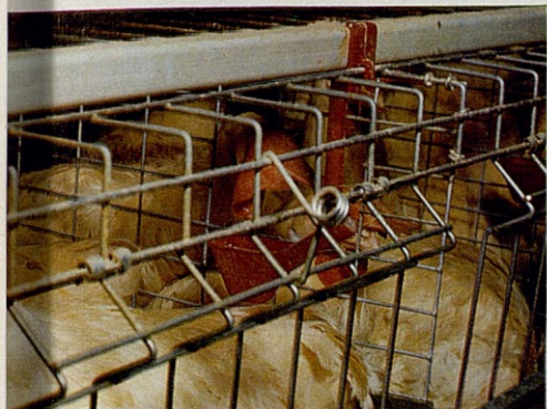
Bebedero de copa muy eficiente, autolimpiante. Todo el frente es puerta, que facilita el manejo de aves.

ARUAS ofrece el nuevo sistema de recogida de huevos por «cadena de cucharillas» y otros sistemas, diversos modelos de baterías.