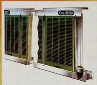
Paneles de refrigeración.