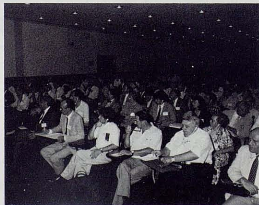
Aspecto de una de las salas en las que se celebró la Conferencia durante la ceremonia inaugural.

Dentro de cada tema, estas comunicaciones se agruparon en determinados grupos con el fin de ser leídas y discutidas con una cierta homogeneidad. Cada autor dispuso de