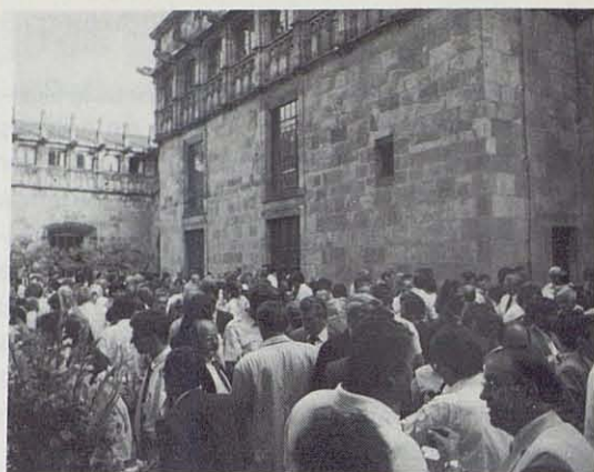
El Patio de los Naranjos, en el Palacio de la Generalitat, durante la recepción ofrecida por ésta a los congresistas.