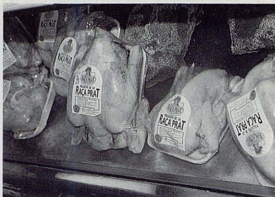
Pollos, capones y poulardas envasados, con el distintivo de calidad "Q", expuestos en el stand de la Asociación de Criadores de la Raza Prat.

Otro aspecto de interés, desde el punto de vista técnico es la escasa asistencia que registra la jornada técnica. Alguien nos decía a la salida de la misma que, "como verás,