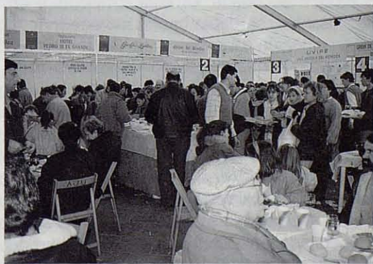
La exposición de la Raza Prat registró una gran afluencia de visitantes.