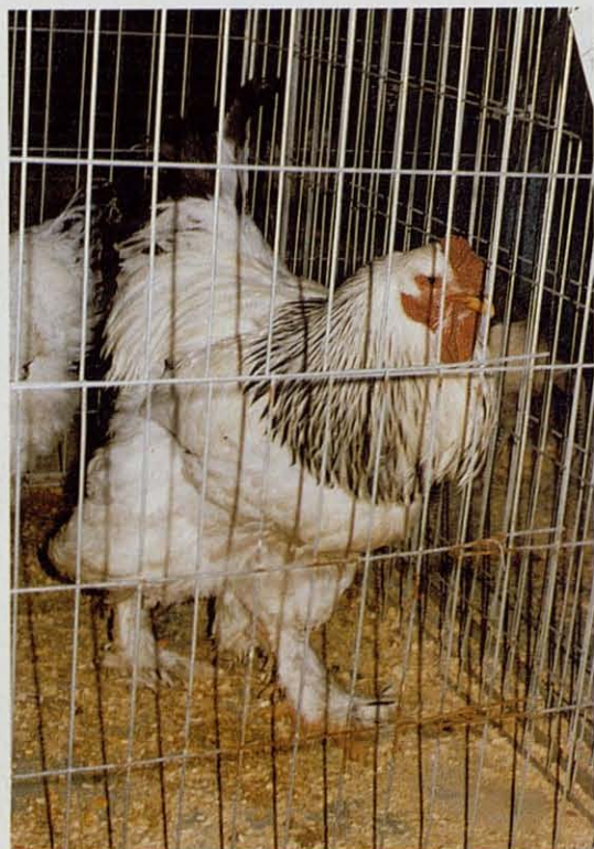
Gallina "Brahma armiñada".

Con motivo de los actos del V Centenario del Descubrimiento de América se ha dado un realce especial a la Feria de Zafra y se