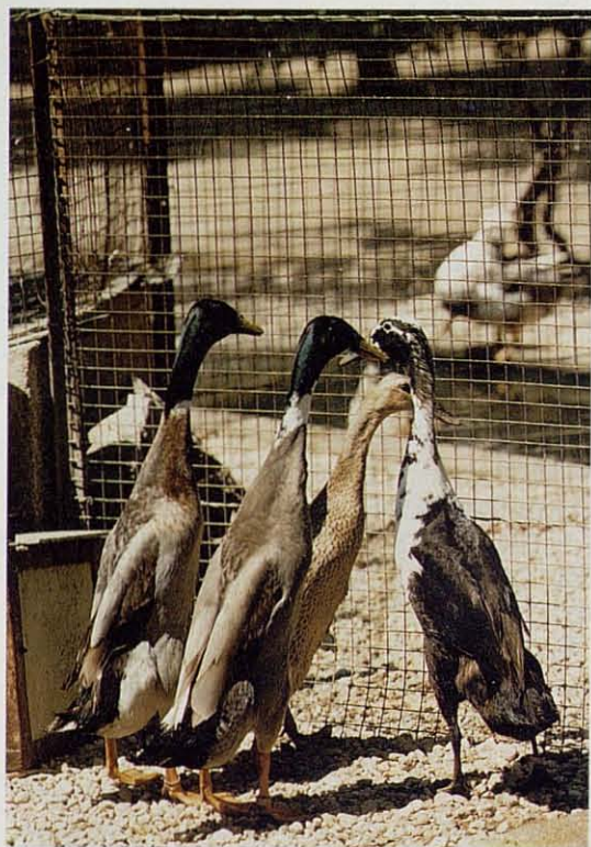
Pato "Corredor Indio".

mostrar el estado actual de las razas de aves en España y otros países en donde las mismas forman parte del patrimonio zootécnico, para que sirvan de orientación, recreo y estímulo a los avicultores y criadores aficionados.