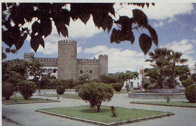
Parador Nacional de Turismo "Hernán Cortés."