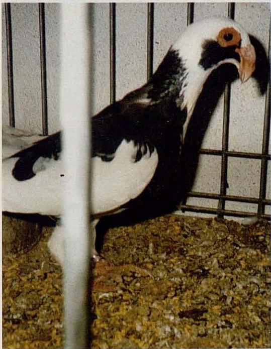
Paloma "Bagadais de Nuremberg"