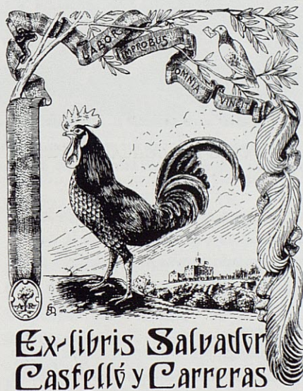
Ex-libris de Salvador Castelló, rezando "Labor improbus omnia vincit", es decir, "El trabajo esforzado todo lo vence".

Fray Miguel Agustín, con el título "Libro de los secretos de Agricultura, Casa de Campo y Pastoril", en la versión castellana de 1722. Contiene 2 capítulos dedicados a la Avicultura, uno a las gallinas y otro a los ánades y ánades. Su exposición corresponde al trabajo de un erudito. Han de transcurrir años para que aparezca una nueva avicultura práctica. En 1781 Francisco Dieste y Buil, vecino de la villa de Lanaja, publica un "Tratado económico dividido en tres discursos". En el primero se ocupa de la crianza de gallinas