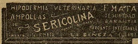
SERICOLINA PURGANTE INYECTABLE