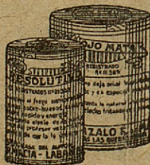
RESOLUTIVO ROJO MATA

Contra cólicos e indigestiones en toda clase de ganado