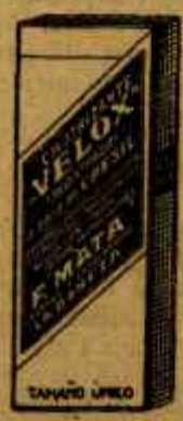
VELOX Hemostático poderoso Clarificante sin olor Poderoso antiseptico