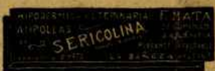
SERICOLINA PURGANTE INYECTABLE