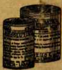
RESOLUTIVO ROJO MATA Purgante resolutivo y resolvente

Exíjanse envases originales MUESTRAS A DISPOSICIÓN DE LOS PROFESORES QUE LO SOLICITEN. DIRIGIÉNDOSE AL AUTOR.