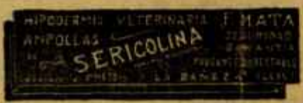
SERICOLINA PURBANTE INYECTABLE