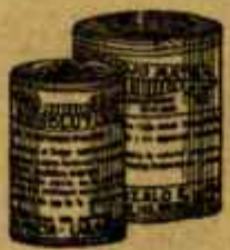
RESOLUTIVO ROJO MATA Poderoso resorbente y reabsorbe