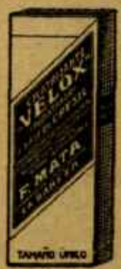
S-BATRIZANTE "VELOX" Inyectable púrpura Clasificación 110 1100 Poderoso antipalúdico E.S.A. Mons. - Barcelona - Lugo