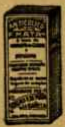
Anticólico F. MATA Contra cólicos e indigestiones en 10-15 minutos de acción