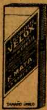
DISFRAZANTE "VELOX" Hemostático potente Construye en 48 hrs. Poderes sólidos ESPAÑA Málaga - Barcelona - Lugo