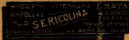
SERICOLINA PURGANTE INTEGRAL