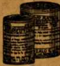
RESOLUTIVO ROJO MATA Poderoso resolutivo y reductor