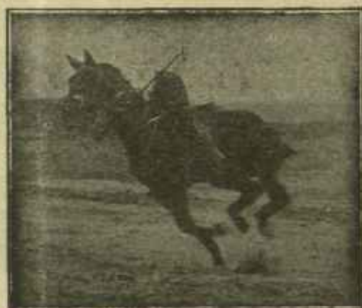
Caballo «Almazanero» desechado del Ejército por «debilidad senil» jugando un partido de polo a los dos años de haber sido injertado

ñor Gallástegui, dió el día 4 del corriente en el Círculo Mercantil de Vigo una magnífica conferencia, en defensa de la Misión biológica de Galicia, que con tanto acierto dirige, y aunque hemos de publicar en el número próximo íntegra la amplia referencia que de tan importante acto dió El Pueblo Gallego , no quere-mos dejar de consignar hoy la noticia y felicitar al Sr. Gallástegui por el legítimo éxito logrado con su disertación.