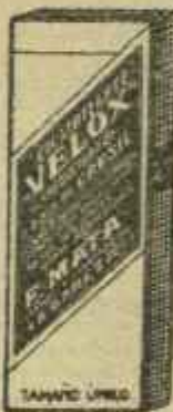
VELOX Hemostático poderoso Clasificado en 1ª clase Medicamento antídoto S. M. S. Deposito: Barcelona - Lugo