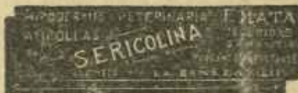
SERICOLINA PURBANTO INYECCABLE