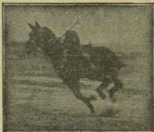
Caballo «Almazarrero» desechado del Ejército por «debilidad senil» jugando un partido de polo a los dos años de haber sido injertado

lativo a que dichos subdelegados interinos pueden acudir a las oposiciones que se están ya celebrando, así como la nota de Redacción en la que dice es de esperar que el examen de aptitud que se exija a los subdelegados interinos, para confirmarlos en propiedad sea una prueba seria; y después de analizar la convocatoria de las actuales oposiciones a determinadas modalidades de veterinarios higienistas, saca la conclusión de que «No hay en ella subdelegaciones en perspectiva, ni tampoco títulos de veterinarios higienistas escuetas, y, por lo tanto, prosigue, la convocatoria de esos exámenes no dá derecho a otra cosa que a los fines para los cuales se ha hecho».