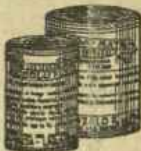
RESOLUTIVO ROJO MATA Medicamento registrado y homologado