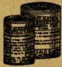
RESOLUTIVO ROJO MATA Poderoso hemostático y tónico