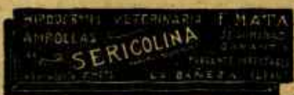
SERICOLINA PURGANTE EFECTIVO