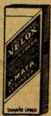
SEPTUAGINTA "VELOX" Homonúcleo potrosol Coagulante en agua Poderoso antiseptico E.T.S. Mata - Resoliva - Urea