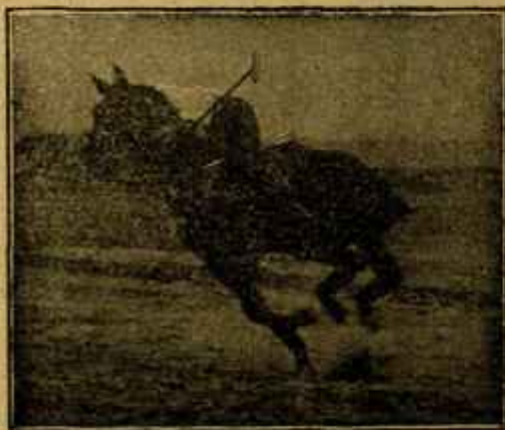
Caballo «Almazarrero» desechado del Ejército por «debilidad senil» jugando un partido de polo a los dos años de haber sido injertado.

personalmente tomaba las iniciativas de esta índole, como aquella famosa de la Asamblea de Federación de Colegios, sin tomarse el trabajo de consultar antes la opinión de la colectividad.