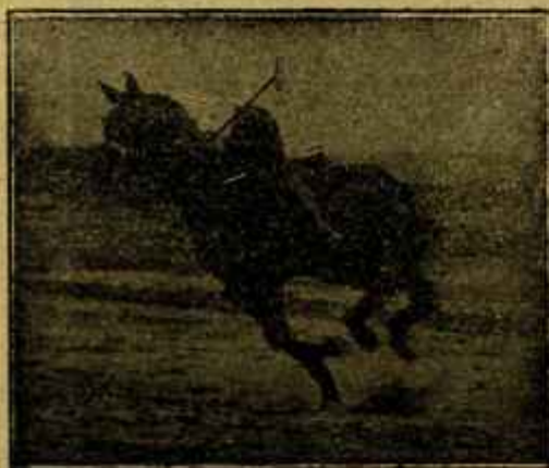
Caballo «Almazarrero» desechado del Ejército por «debilidad senil» jugando un partido de polo a los dos años de haber sido injertado.

dad de las cosas induce al hombre al desprecio o al amor. Solamente cuando el ser humano no es egoísta, va por el camino de la indiferencia.