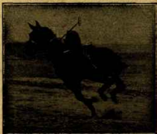
Caballo «Almazarrero» desechado del Ejército por «debilidad senil» jugando un partido de polo a los dos años de haber sido injertado.