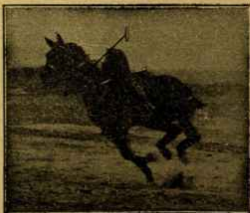
Caballo «Almazarrero» desechado del Ejército por «pebilidad senil» jugando un partido de polo a los dos años de haber sido injertado.

Aunque hasta ahora nada hay legislado respecto a la significación de dichas plazas ni al modo de proveerlas, el calificativo de repetidores que llevarán sus futuros propietarios parece indicar una transformación en el concepto del profesor auxiliar tal como se ha entendido en Veterinaria y una asimilación de este concepto al carácter que tienen en las Universidades donde, como se sabe, son temporales y su nombramiento propuesto—previo examen o prueba realizados en el mismo centro de la vacante—por el claustro correspondiente.