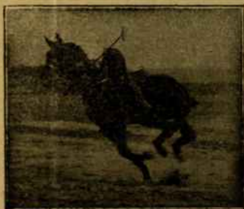
Caballo «Almazarrero» desechado del Ejército por «pe- bilidad senil» jugando un partido de polo a los dos años de haber sido injertado.

para la venta en España INDUSTRIAS SANITARIAS S. A.: BARCELONA MADRID-SEVILLA-VALENCIA