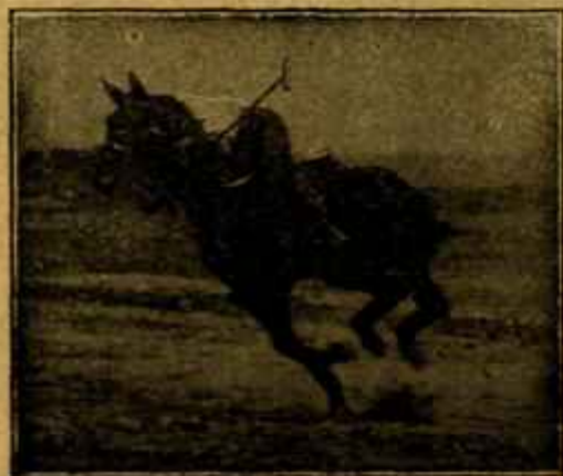
Caballo «Almazarrero» desechado del Ejército por «peblidad senil» jugando un partido de polo a los dos años de haber sido injertado.

posiciones vigentes, y siendo designado en primer lugar, a igualdad de tiempo servido, el más moderno.