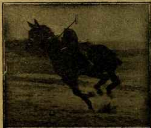
Caballo «Almazarrero» desechado del Ejército por «debilidad senil» jugando un partido de polo a los dos años de haber sido injertado.

para la venta en España INDUSTRIAS SANITARIAS S. A.: BARCELONA MADRID-SEVILLA-VALENCIA