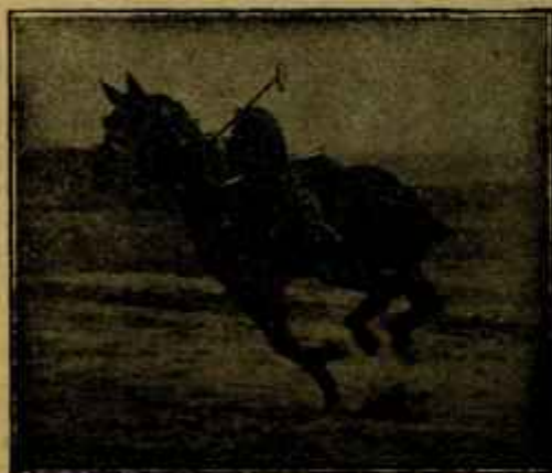
Caballo «Almazarrero» desechado del Ejército por «debilidad senil» jugando un partido de polo a los dos años de haber sido injertado.

ingresando en el Hospital militar. Lamentamos el percance y deseamos el rápido restablecimiento de nuestro querido compañero.