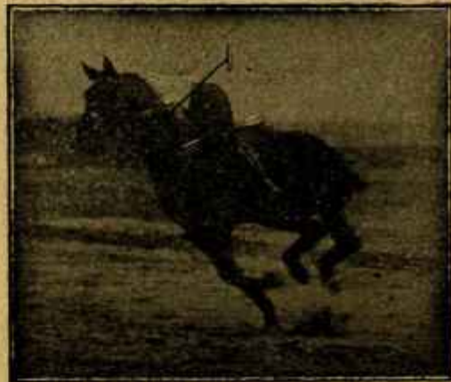
Caballo «Almizarrero» desechado del Ejército por «debilidad senil» jugando un partido de polo a los dos años de haber sido injertado.

para la venta en España: INDUSTRIAS SANITARIAS S. A. BARCELONA MADRID-SEVILLA-VALENCIA