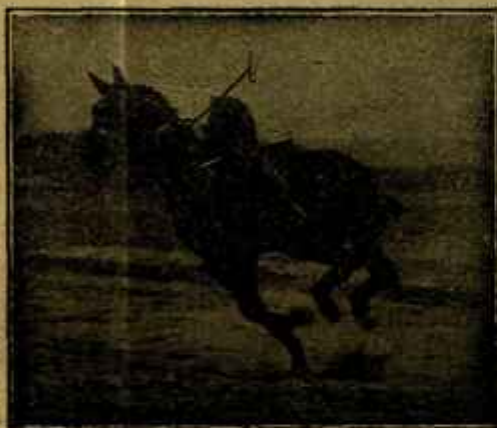
Caballo «Almazarrero» desechado del Ejército por «debilidad senil» jugando un partido de polo a los dos años de haber sido injertado.

suelo que corresponda según el artículo 106 del Reglamento de Empleados municipales. Solicitudes hasta el 24 de julio.