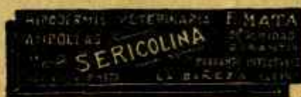
SERICOLINA PURGANTE INYECTABLE