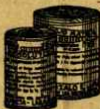
RESOLUTIVO ROJO MATA Poderoso purgante y resaca