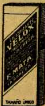
VELOX Hemostático poderoso Clasificado sin igual Poderoso antihémico 1934 García / Rodríguez / López