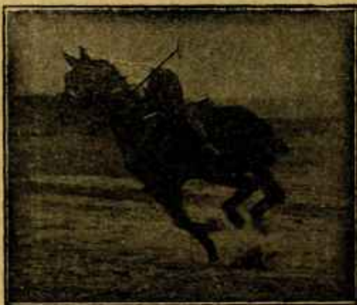
Caballo «Almazarrero» desechado del Ejército por «debilidad senil» jugando un partido de polo a los dos años de haber sido injertado.