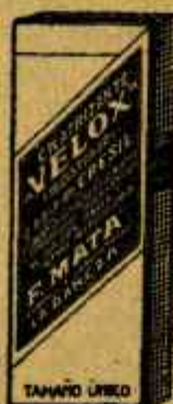
VELOX Homociditas poderosas Clorhidrato sin olor Poderoso antipéptico CASA: S. MATA Vinos: S. MATA - Lugo