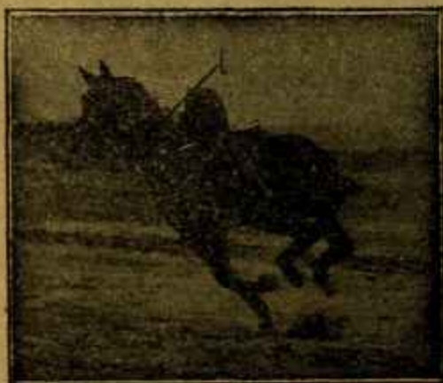
Caballo «Almazarrero» desechado del Ejército por «debilidad senil» jugando un partido de polo a los dos años de haber sido injertado.

para la tercera, dado el caso de que se acordara la permanencia del herrado higiénico, que la matrícula sea voluntaria. Insiste en que la operación del herrado es una práctica empírica, del dominio de obreros manuales como los herradores, pero no de hombres de ciencia como los veterinarios.