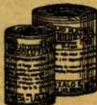
RESOLUTIVO ROJO MATA Poderoso resolutivo y analgésico