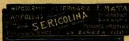
SERICOLINA PURSANTE INECTABLE