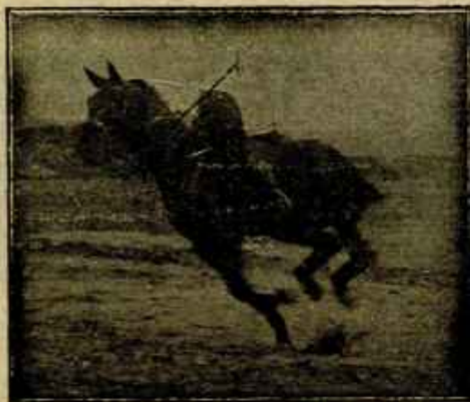
Caballo «Almazarrero» desechado del Ejército por «debilidad senil» jugando un partido de polo a los dos años de haber sido injertado

Como consecuencia de ello aumentan de sueldo casi todos los catedráticos actuales, siendo el aumento de tres mil pesetas para el número dos del escalafón, señor Castro y Valero, que pasa de 12 a 15.000 pesetas, pues la segunda categoría actual, o sea la de 12.500 anuales, no existía antes, según puede verse con más detalles en la Real orden de Instrucción pública que publicamos en otro lugar de este número.