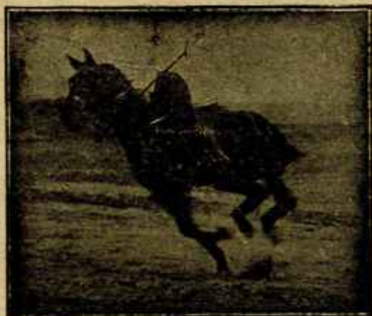
Caballo «Almazarrero» desechado del Ejército por «debilidad senil» jugando un partido de polo a los dos años de haber sido injertado

difícil. No solo a los veterinarios cordobeses, sino también a los de otras provincias, les constan que son dos tipos perfectos por su amor al trabajo, por su progreso moral y cultura científica, resultando por eso que ha sido mayor el número de solicitantes que el de plazas había anunciadas; los quince primeros por orden de fecha de presentación de instancias fueron admitidos como alumnos y los restantes quedaron para ocupar los primeros puestos en los sucesivos cursos que se celebrarán de enero a mayo del próximo año. Prueba más fehaciente de la competencia de los dos ilustres profesionales, no cabe, así como demuestra que en la profesión Veterinaria se mece un espíritu joven que anhela saber y ponerse a tono con las necesidades actuales.