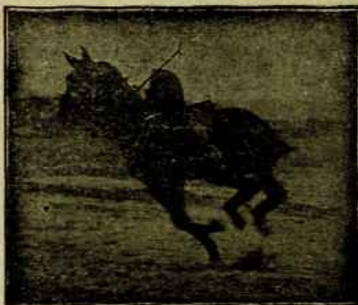
Caballo «Almazarrero» desechado del Ejército por «debilidad senil» jugando un partido de polo a los dos años de haber sido injertado