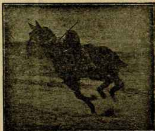
Caballo «Almazarrero» desechado del Ejército por «debilidad senil» jugando un partido de polo a los dos años de haber sido injertado

señor mío: Contesto su grata de 13 del corriente, para manifestarle que, en atención al concepto que le ha merecido a SEMANA VETERINARIA la Asociación Nacional de Inspectores de Higiene Pecuaria desde su creación, no puedo autorizarle a enviar el redactor que indica en la suya, con un fin informativo.—Atentamente le saluda su affmo. s. s.— José Orensanz. »