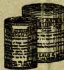
RESOLUTIVO ROJO MATA Poderoso regulador y remedio