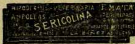
SERICOLINA PURGANTE INYECTABLE