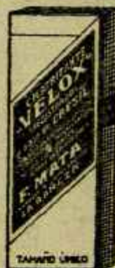
GRATIFICANTE "VELOX" Mantén las potencias Clasificación de 1ª y 2ª Poderoso Antidépico SOL. S. S. S. Vinos y Reservas y Líquidos