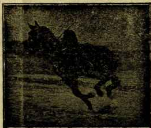
Caballo «Almazarrero» desechado del Ejército por «debilidad senil» jugando un partido de polo a los dos años de haber sido injertado

del Real decreto número 2.734 de 13 de diciembre de 1930 sobre Paradas de sementales y como aclaración al expresado Real decreto,