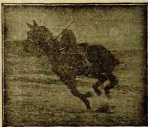
Caballo «Almazarrero» desechado del Ejército por «debilidad senil» jugando un partido de polo a los dos años de haber sido injertado

da y lironda, y nuestro director la desmintió con la siguiente carta publicada el lunes 16 del actual: