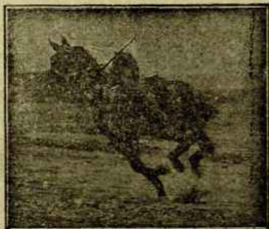
Caballo «Almazarrero» desechado del Ejército por «debilidad senil» jugando un partido de polo a los dos años de haber sido injertado

patentado, compuesto de: Un trócar, una cánula cortante con émbolo metálico, un escarificador especial, colocado en estuche de metal niquelado.