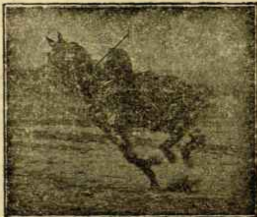
Caballo «Almazarrero» desechado del Ejército por «debilidad senil» jugando un partido de polo a los dos años de haber sido injertado

veterinarios, ni creo que para optar a aquellos cargos sea condición precisa poseer título académico alguno; siendo uno de sus servicios—quizá el principal—el mismo que desempeñan los veterinarios en funciones de amanuenses del p. H.; con la sola diferencia de que, aquellos señores, parecen que están poseídos de mayor autoridad.