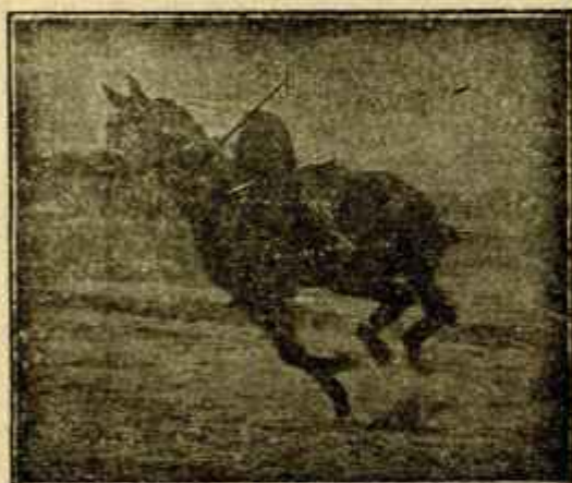
Caballo «Almazarrero» desechado del Ejército por «debilidad senil» jugando un partido de polo a los dos años de haber sido injertado.

—Titular de Anchuelo (Madrid), con 365 pesetas. Plazo hasta 31 del actual.