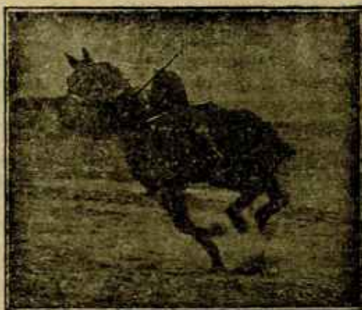
Caballo «Almazarrero» desechado del Ejército por «debilidad senil» jugando un partido de polo a los dos años de haber sido injertado

Artículo 3.º Los generales, jefes, oficiales y asimilados que se acojan a los beneficios ofrecidos en los artículos precedentes, podrán obtener y perfeccionar sus derechos para la Gran Cruz, Placa y Cruz de San Hermenegildo, con las pensiones correspondientes, en todo el tiempo que permanezcan en la situación de reserva o de retirado.