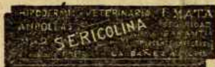
SERICOLINA PURGANTE INYECTABLE