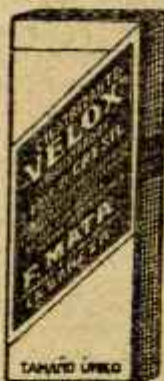
VELOX Hemostático poderoso Efectuante sin ligas Poderoso antiseptico