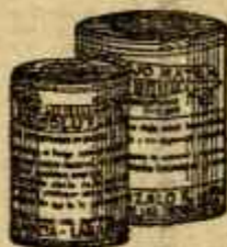
RESOLUTIVO ROJO MATA Purgante regulador y resolutor