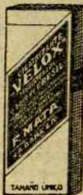
CICATRIZANTE "VELOX" Hemostático poderoso Cicatrizante sin ligas Podrá ser utilizado