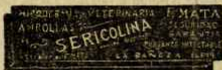
SERICOLINA PURGANTE INTESTINAL