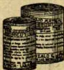
RESOLUTIVO ROJO MATA

Contra cólicos e indigestiones en toda clase de ganado