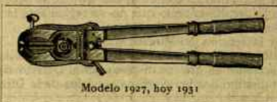
Modelo 1927, hoy 1931

Se manda inmediatamente por ferrocarril a reembolso por