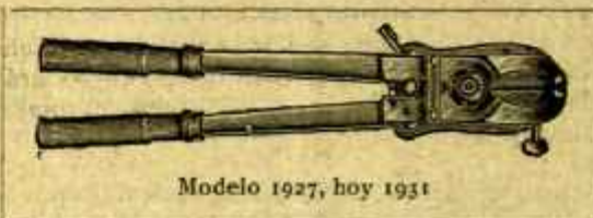
Modelo 1927, hoy 1931

Se manda inmediatamente por ferrocarril a reembolso por