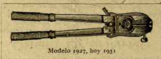
Modelo 1927, hoy 1931

Se manda inmediatamente por ferrocarril a reembolso por