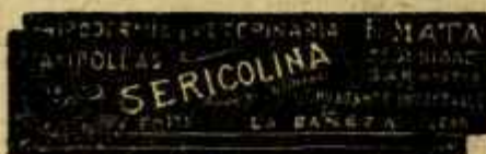
SERICOLINA PURGANTE INYECTABLE