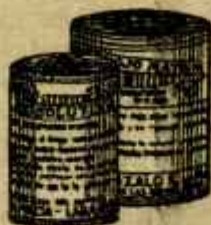
RESOLUTIVO ROJO MATA

Causa tifoidea e infecciones en toda clase de ganado