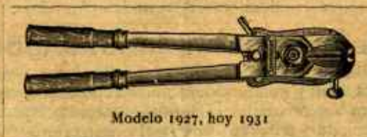
Modelo 1927, hoy 1931

Se mandan inmediatamente por ferrocarril reembolso por